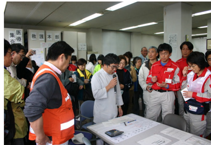
能登半島地震の際 議長は山岸能登北部医師会長