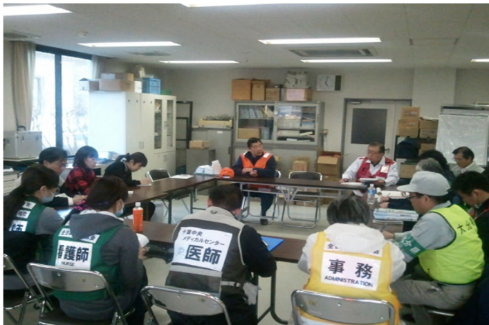
医師会長がご都合が悪くても議長席は設置