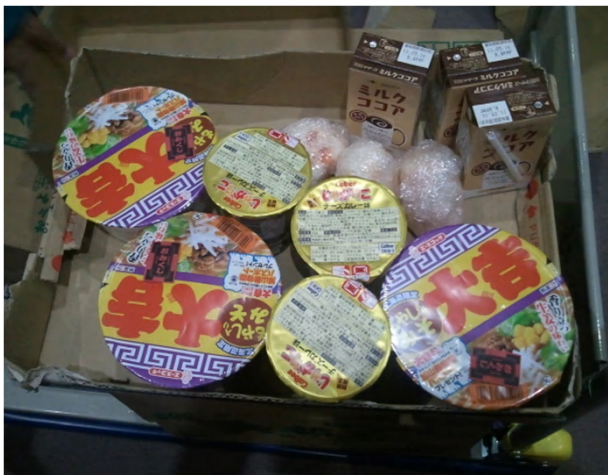
被災後3週間後の夕食